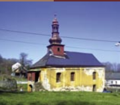
Javory 1, 405 02 Malšovice www.iniciativaostrov.estranky.cz

Původně kaple sv. Prokopa vznikla roku 1749 na přání místních obyvatel, kteří se ke světcům modlili o dobrou úrodu. Původní stavba byla několikrát doplněna a rozšířena na kostel. Po roce 1945 objekt chátral a vnitřní vybavení bylo rozvezeno do jiných kostelů. V současnosti probíhá postupná obnova. Na svátek sv. Prokopa se na Javory koná nyní již tradiční pouť.