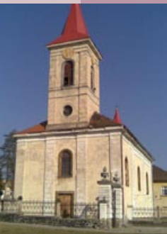
Modlany, 417 13 Modlany www.teplice-city.cz/rk/

První zpráva o existenci obce je dokládána z roku 1328. Při severovýchodní části návsi, nad potokem obci dominoval a dodnes dominuje kostel sv. Apolináře ze 14. století (rok 1384). Později byl vypálen husity. S kostelem sousedí fara, která sehrála v dějinách obce a okolí významnou kulturní a náboženskou úlohu, ve 14. století se Modlany staly farní vsí. V letech 1687 až 1691 pán Jiří Marek vystavěl nový kostel sv. Apolináře, který byl předán jezuitům. Po zrušení jezuitského řádu v roce 1773 připadají Modlany státu. V roce 1779 pak Marie Terezie předává statek do majetku kostela v Bohosudově.