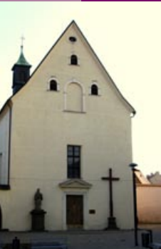
Kapucínské nám. Litoměřice