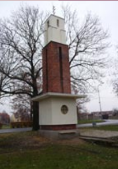
ul. Husova, Lenešice www.ccsch.cz