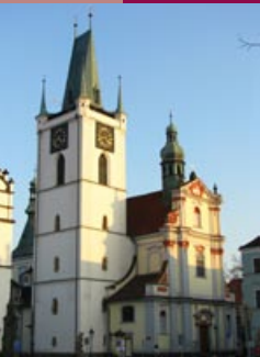
Mírové nám., Litoměřice www.farnost-litomerice.cz