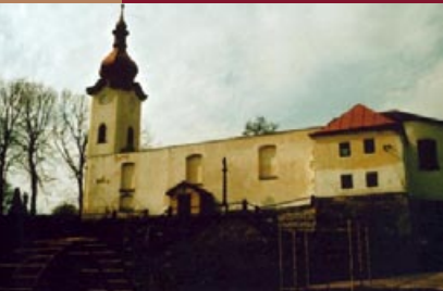
Petrovice, 403 37 Petrovice www.iniciativaostrov.estranky.cz

V roce 1793 byl na vyvýšenině ve středu obce postaven nový barokní kostel, zasvěcený sv. Mikuláši. Hlavní kamenný oltář měl po stranách dva sloupy, mezi kterými se nacházely sochy sv. Petra a sv. Pavla. Střed vyplňoval obraz sv. Mikuláše. Kostelní věž s cibulovitou střechou byla k štítové stěně přistavěna v roce 1904. Po neodborném stavebním zásahu ve vnitřním prostoru lodě kostela se 11.července 1988 v půl sedmé večer propadla střecha a kostel přestal sloužit svému účelu.