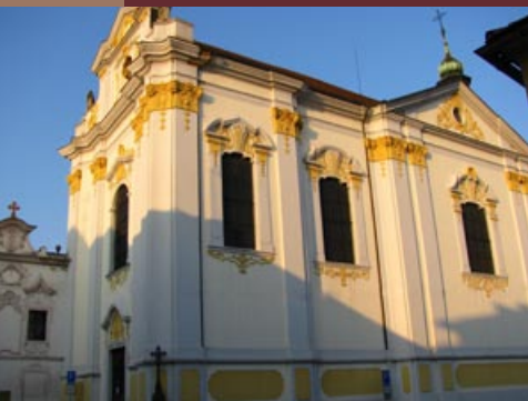
Dominikánské nám., Litoměřice