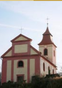
Čermná, 403 33 Libouchec www.iniciativaostrov.estranky.cz

Kostel sv. Mikuláše nad Červeným potokem vznikl pravděpodobně již před rokem 1364. Jak vyhlížel tehdejší kostel, není známo. Dnešní podoba kostela je výsledkem celkové barokní přestavby. Léta opomíjený chátrající areál kostela má stále šanci stát se i se zachováním pozůstatků konzervovaného interiérového vybavení opět přirozeným centrem kulturního dění obce, zvláště poté, co byl kostel prohlášen závěrem roku 2007 za kulturní památku.