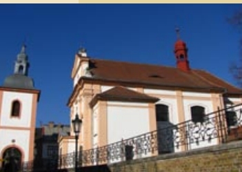
Vojtěšská ul., Litoměřice www.farnost-litomerice.cz

V místech staré osady Zásada, připomínané již r. 1057, byl vystavěn kostel sv. Vojtěcha, poprvé zmiňovaný k roku 1363. V letech 1703-08 jej barokně přestavěl Octavio Broggio, patrně dle staršího návrhu svého otce Giulia z roku 1689. Na místě původní dřevěné byla vystavěna r. 1774 nová věžovitá zvonice, kde jsou, stejně jako na přilehlém bývalém hřbitově, renesanční a empírové náhrobky.