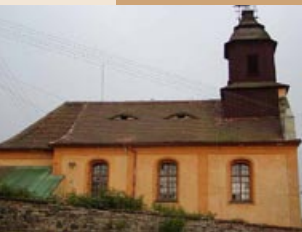
Bžany-Hradiště, 415 01 Bžany www.bzany.info

Kostel pochází z r.1691 původně byl gotický přestavba v r. 1769 na spíše barokní. Kostel je jednoduší s odsazeným presbytářem, bedněná věžice za barokním štítovým nástavcem, zvláštnost je šindelová střecha na dřevěné věži.V kostele jsou náhrobní kameny dam z rodu Kolovratů a Vřesovických a také p.faráře Andrease Aumyera který v r.1680 zemřel na mor.V lodi necková klenba, v pravouhlém presbytáři s freskou poslední večeře zřejmě z r. 1769. V průčelní věži se nachází vzácný zvon z 15. století, který je nejstarším zvonom na Teplicku.