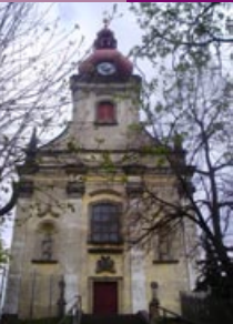
Jeníkov 1, 417 24 Oldřichov u Duchcova www.fatym.com

příležitostně, nedělní bohoslužby v kostele sv. Františka z Assisi v Děčíně - Podmoklech